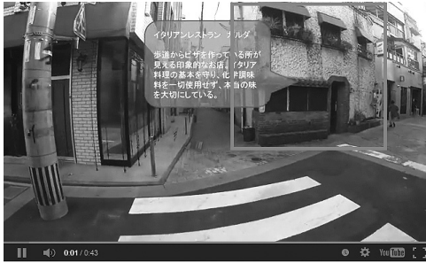
図4.2.5 通りを南下する際の動画上の店舗