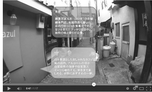
図4.2.3 吹き出しが左右の店舗で2つの場合

図4.2.4は1つの建物の2階に3つの店があり、1つの大きな吹き出しに3つの情報を示している。吹き出しの色は、背景の色と少々似ているものもあるがまったくの同じ色はなく、どの吹き出しも見やすく、透過のおかげで背景を確認することができ、文字のサイズも適切である。しかし、空が背景となる部分は空の色と文字の色がかぶるってしまうため若干読みづらい。