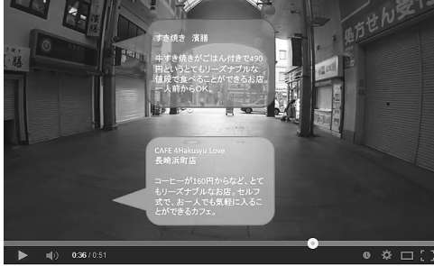
図4.1.2 吹き出しが2つの場合