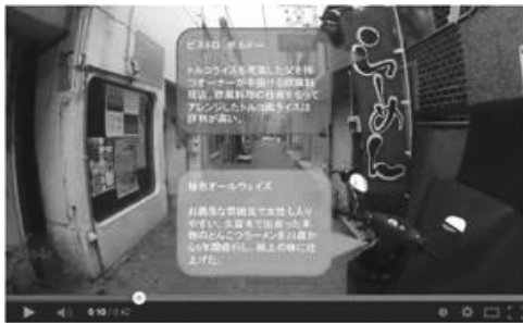
図4.2.2 吹き出しが上下の店舗で2つの場合