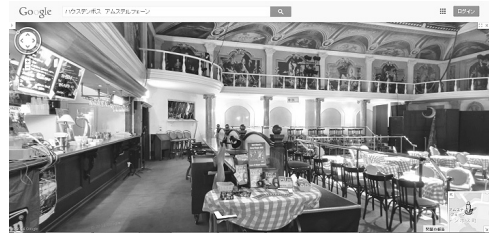
図2.2.1 ハウステンボス内の店舗のおみせフォトの一例

撮影チームに撮影を依頼することでおみせフォトを導入できるようになった。屋外のストリートビューとほぼシームレスに繋がっており、ストリートビュー内で進行方向を示す矢印が二重になっているものをクリックすると、店内の写真に切り替わる。長崎のハウステンボスや長崎市内のおみせフォトの一例を図2.2.1と図2.2.2にそれぞれ示す。