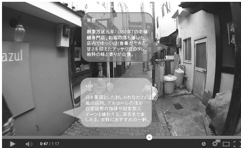
図3.3.2 通りの両側に店舗がある場合