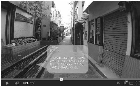
図4.2.1 吹き出しが1つの場合

図4.2.1は1つの吹き出しを表示する場合を示す。図4.2.2は1階と2階に店がある場合で、図4.2.3は両側に店がある場合である。どちらも2つの吹き出しでそれぞれの店を紹介している。