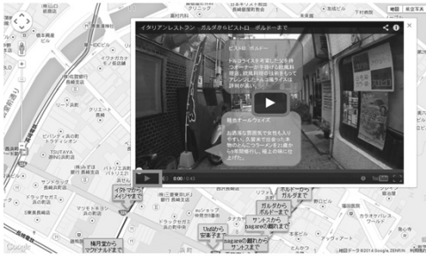
図2.3.1 提案システム動作画面

ブロードし、撮影した通りのGPS座標をもとにGoogleマップ上に動画をマッピングする。ストリートビューやおみせフォトとは異なり、映像コンテンツを用いて街並みを紹介することでまちぶら感覚で臨場感を保ちつつ店舗の情報を確認することができる。提案システム動作画面の一例を図2.3.1に示す。地図上のマーカーをクリックすると動画を表示する吹き出しが現れるようになっている。