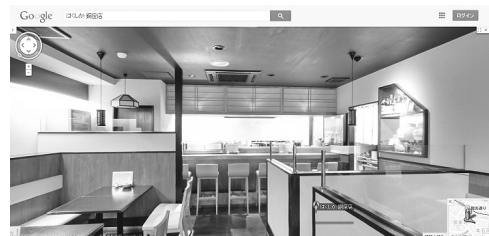
図2.2.2 長崎市内の店舗のおみせフォトの一例

外観と内観の両方を確認できるということで、実際に行かなくてもお店の雰囲気をまるで店内にいるかのように身近に感じ、外から店内が覗けないような作りの店への新たな集客につながる。しかし、店内に客がないため臨場感が大幅に不足することは否めない。