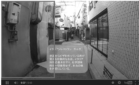
図4.2.6 通りを北上する際の動画上の店舗