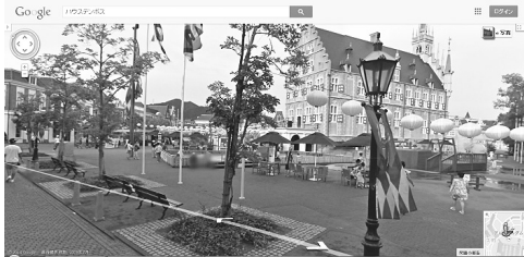
図2.1.2 ハウステンボスのストリートビュー画面

このように、ストリートビューは、これから向かう場所を事前に確認したり、旅行の行程をチェックしたり、普段行けないようなところをバーチャルに散歩してみたりと様々な使い方ができる。しかし、確認できるのは、そこに写っている風景や街並みのみであり、店舗情報などは別途検索する必要がある。また、表示される風景の中をクリックにより進むことはできるが、表示されるのは細切れの画像のみであり、臨場感が全くない。