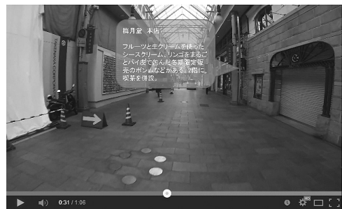
図4.1.1 吹き出しが1つの場合

図4.1.1は1つの吹き出しを表示する場合、図4.1.2は2つの吹き出しを同時に表示する場合の図である。吹き出しの色はどちらも背景にはなく、吹き出しも見やすく、透過も行っているため背景を確認することができ、文字のサイズは背景を邪魔することなく読むことができている。しかし、文字の色は図4.1.2を見ると、下側に吹き出しがある場合は見やすいが、上側に吹き出しがある場合は、空が背景となる部分は少し見づらい。また、吹き出しの幅が路地裏の細い通りに合わせているため、店と吹き出しの間に距離があり、下側の吹き出しがどの店を示しているのか若干わかりにくいことがわかった。