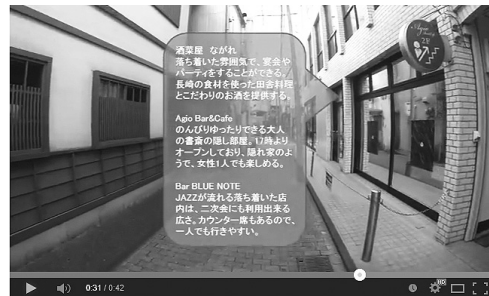
図4.2.4 3つの店舗で1つの吹き出しの場合

図4.2.4は1つの建物の2階に3つの店があり、1つの大きな吹き出しに3つの情報を示している。吹き出しの色は、背景の色と少々似ているものもあるがまったくの同じ色はなく、どの吹き出しも見やすく、透過のおかげで背景を確認することができ、文字のサイズも適切である。しかし、空が背景となる部分は空の色と文字の色がかぶるってしまうため若干読みづらい。