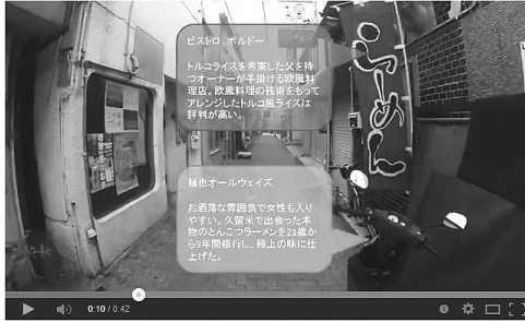
図3.3.1 1階と2階に店舗がある場合